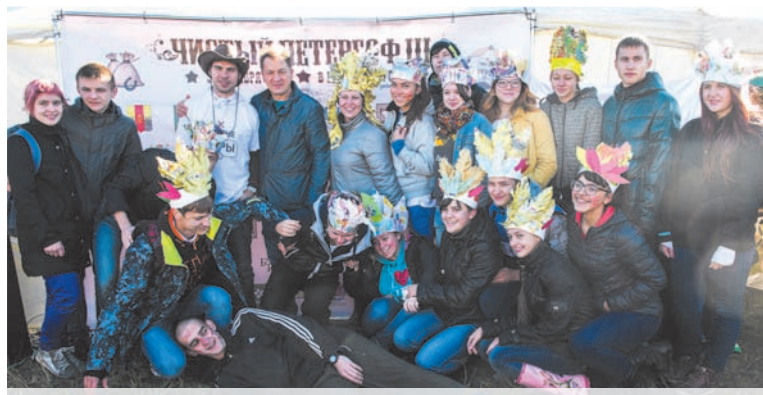
За последние годы в Петергофе прошли четыре экологические игры «Чистый Петергоф», в ходе которых волонтеры вывезли тонны мусора из Английского и Лугового парков. Взаимодействие с экологическими активистами помогает муниципалам Петергофа решать проблемы уборки мусора на бесхозных и неподконтрольных им территориях.

А вот что бывает из-за отсутствия закона. Пять лет назад органам местного самоуправления запретили за счет местного бюджета заниматься сбором и вывозом бытовых отходов и мусора с территории индивидуальной жилой застройки. До запрета мы обустраивали контейнерные площадки, с которых мусор затем вывозили. Площадки для сбора пришлось демонтировать, облагораживать, чтобы по привлекательности ими не пользовались. Вместо этого жителям предложили (и до сих пор предлагаем) самим заключать договоры с подрядными организациями на вывоз мусора. Кто-то откликнулся на наши призывы, но большинство не согласилось с такой альтернативой. Закона, устанавливающего правила,