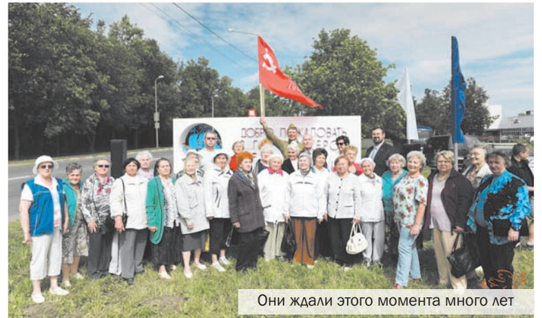
Они ждали этого момента много лет

После минуты молчания в честь всех погибших в Великую Отечественную войну стела была, наконец, открыта, представ перед собравшимися во всей своей красе. Примечательно, что церемонии не посетили ни районные, ни муниципальные власти. Там считают неуместным открывать, по выражению одного из