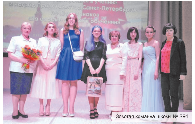
Золотая команда школы № 391

Эти ребята - правда, молодцы. Учиться ведь могут многие, но